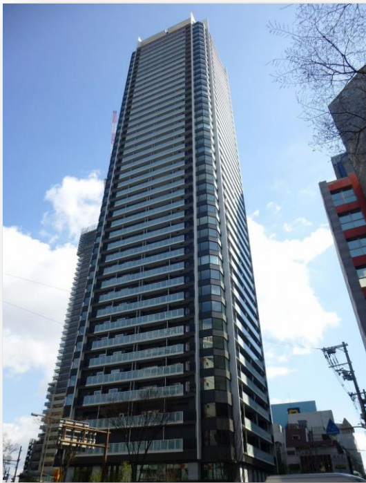
地下鉄御堂筋線「中津」駅徒歩1分