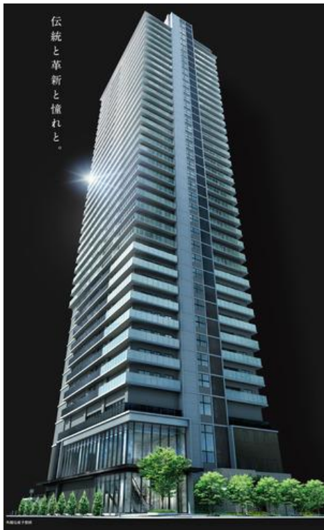
伝統と革新と憧れと。